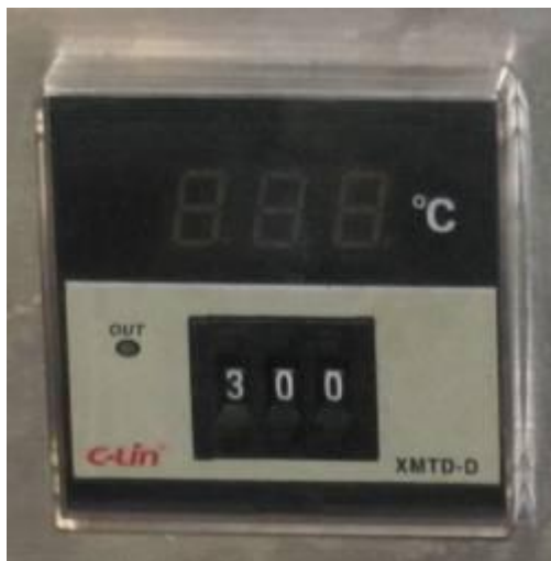
Medidor de temperatura