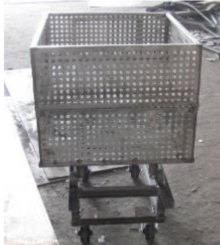
canastos de esterilizacion